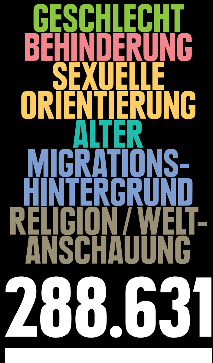
Gesamtbevölkerung (Wohnberechtigte Bevölkerung)

Alle Angaben sofern nicht anders angegeben: Stand: 31.12.2015, Quelle: Melderegister, Bürgeramt © Amt für Statistik und Stadtforschung, Stadt Augsburg